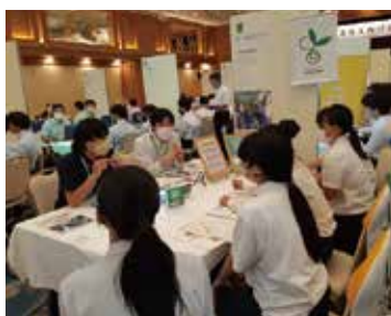
高知会場:三翠園 富士の間