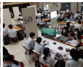
西部会場:ふるさと総合センター1階 大ホール